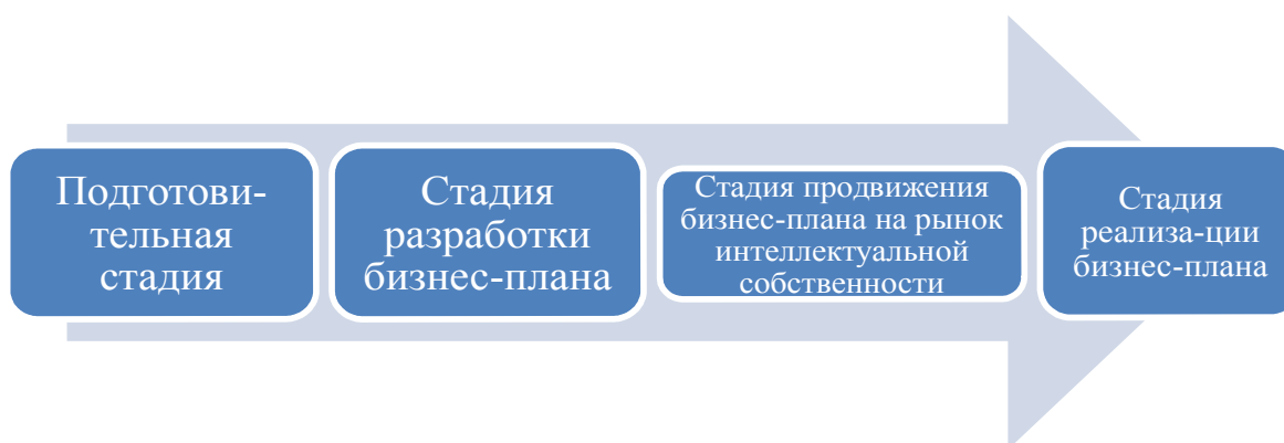
Рис. 1.3 – Основные стадии процесса бизнес-планирования

При построении графических изображений следует руководствоваться следующими правилами: